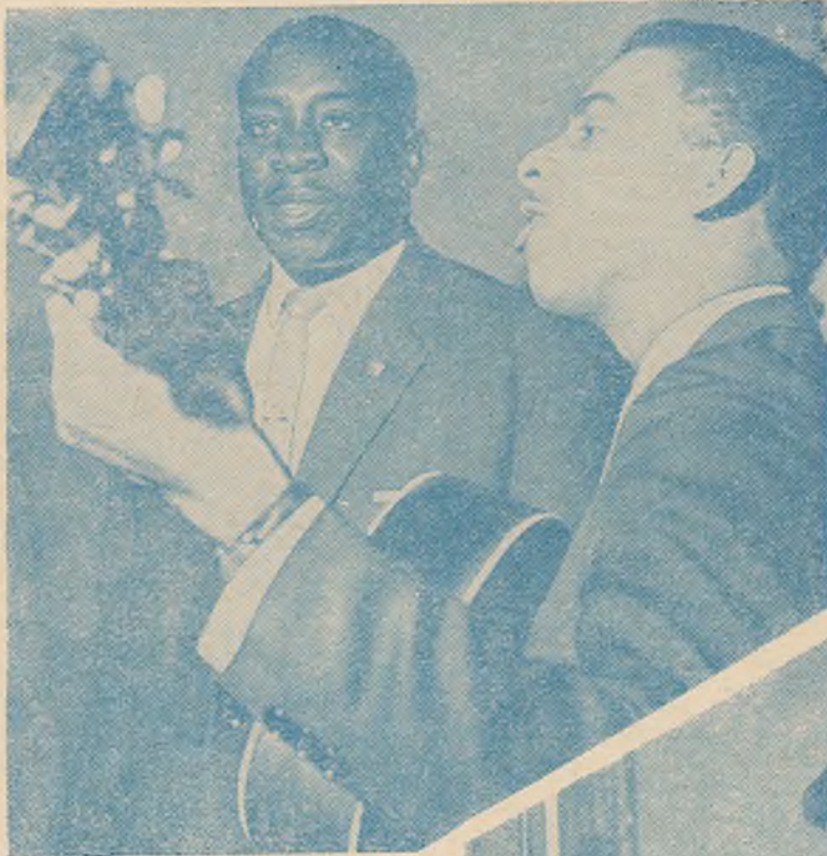
Веды — вялікая сіла

Студэнты з сонечнага В'етнама ўпарта і настойліва авалодваюць ведамі на фізічным, хімічным, біялагічным і матэматычным факультэтах нашага ўніверсітэта. Упэўнена і дакладна адказваюць яны на семінарскіх і практычных занятках, паспяхова здаюць экзамены і залікі.